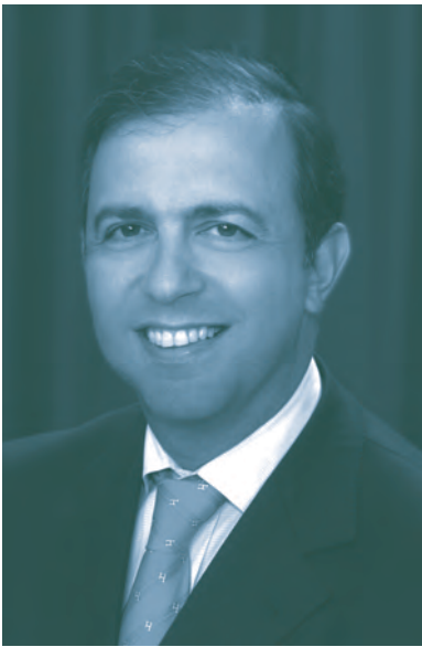
Sam Hamad Ministre de l'Emploi et de la Solidarité sociale

C'est avec plaisir que je vous présente les résultats du sondage sur la mise en œuvre de la politique gouvernementale sur l'action communautaire, intitulée L'action communautaire : une contribution essentielle à l'exercice de la citoyenneté et au développement social du Québec . La politique, rappelons-le, vise à faire reconnaître la contribution de l'action communautaire au développement social du Québec. Elle précise les relations que le gouvernement veut établir et entretenir avec le milieu de l'action communautaire ainsi que le soutien qu'il compte lui apporter.